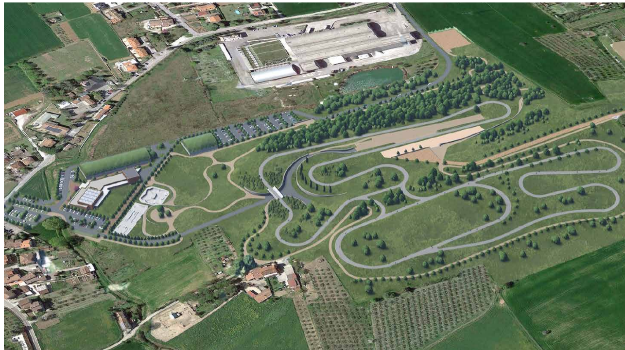
Un rendering del progetto per il Parco dello Sport che sarà realizzato a Sant'Ermete

Il percorso in sicurezza lungo via Casale è il frutto di un'ampia condivisione con i residenti alla ricerca delle migliori soluzioni possibili per dare una risposta a una necessità sentita da tempo dalla frazione. Per la sindaca Alice Parma una ciclabile come quella di via Casale può cambiare la nostra prospettiva, può permetterci di andare a scuola a piedi, magari organizzando un pedibus, può permettere di raggiungere la parrocchia o il luogo di lavoro senza dover utilizzare l'auto. La nuova ciclabile, per la quale è in corso la procedura per l'appalto per una somma di 1,8 milioni di euro per il momento finanziati attraverso mutuo in attesa dell'esito di bandi per l'ottenimento di contributi, rientra nell'ambito del Piano Urbano della Mobilità Sostenibile (Pums). In futuro, potrà essere valutata la fattibilità per un collegamento con il