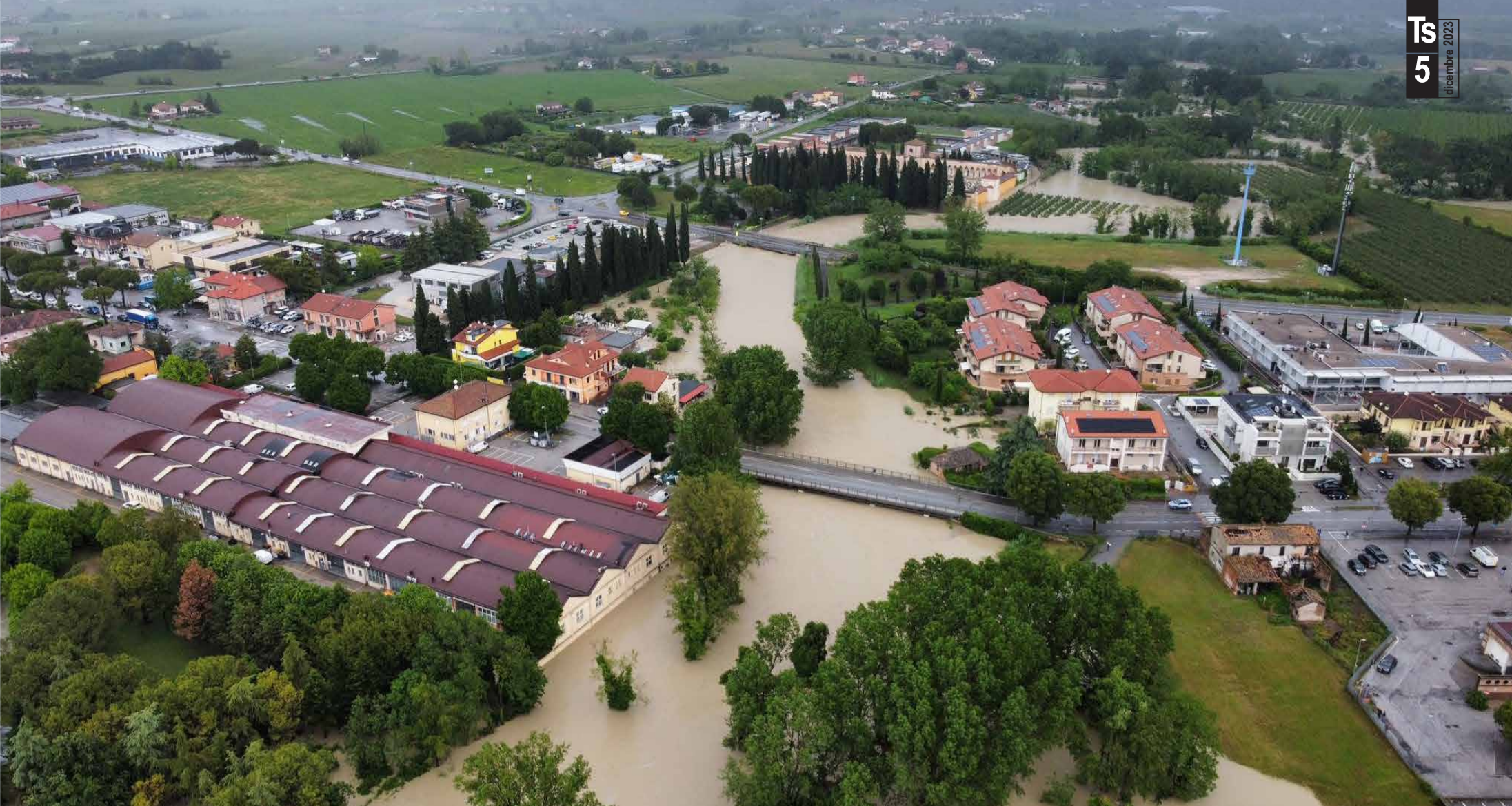
Una foto aerea del ponte sul fiume Uso di via Andrea Costa in occasione degli eventi alluvionali di maggio 2023