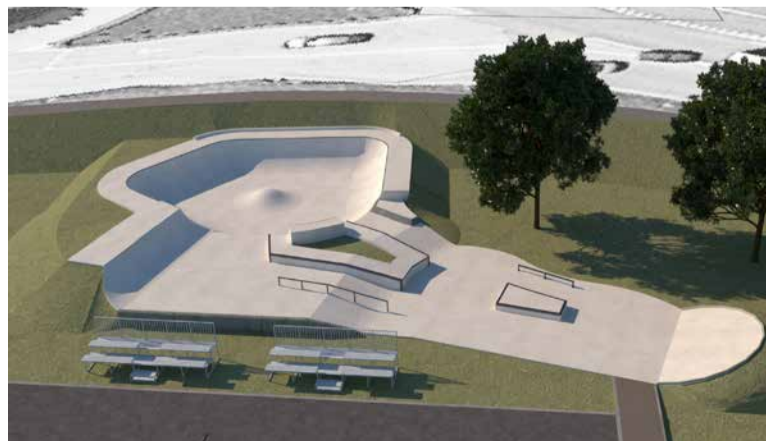
Il rendering dello skate park che sarà realizzato al parco Francolini