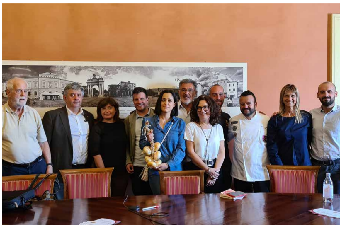
Un momento della conferenza stampa tenutasi nelle scorse settimane per la presentazione dell'avvio del Presidio Slow Food della Cipolla dell'Acqua