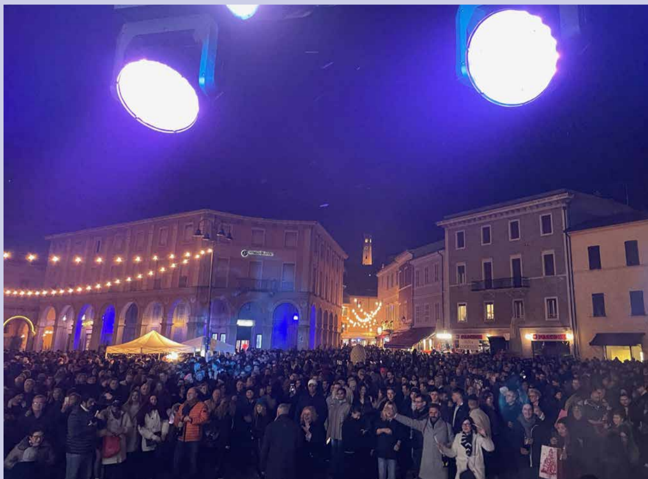
La grande festa di Capodanno 2023

Fino al 29 febbraio sarà visitabile il Grande Presepe Meccanico Gualtieri, allestito all'interno della grotta di piazza Balacchi. Per tutto il periodo delle feste, la Pro Loco organizzerà tour guidati che includeranno la visita alla suggestiva grotta monumentale pubblica con leggende e racconti, alla Casamatta medievale, anticamente situata sotto l'antica Porta di San Michele dove si potrà ammirare una bellissima natività oltre al presepe meccanico.