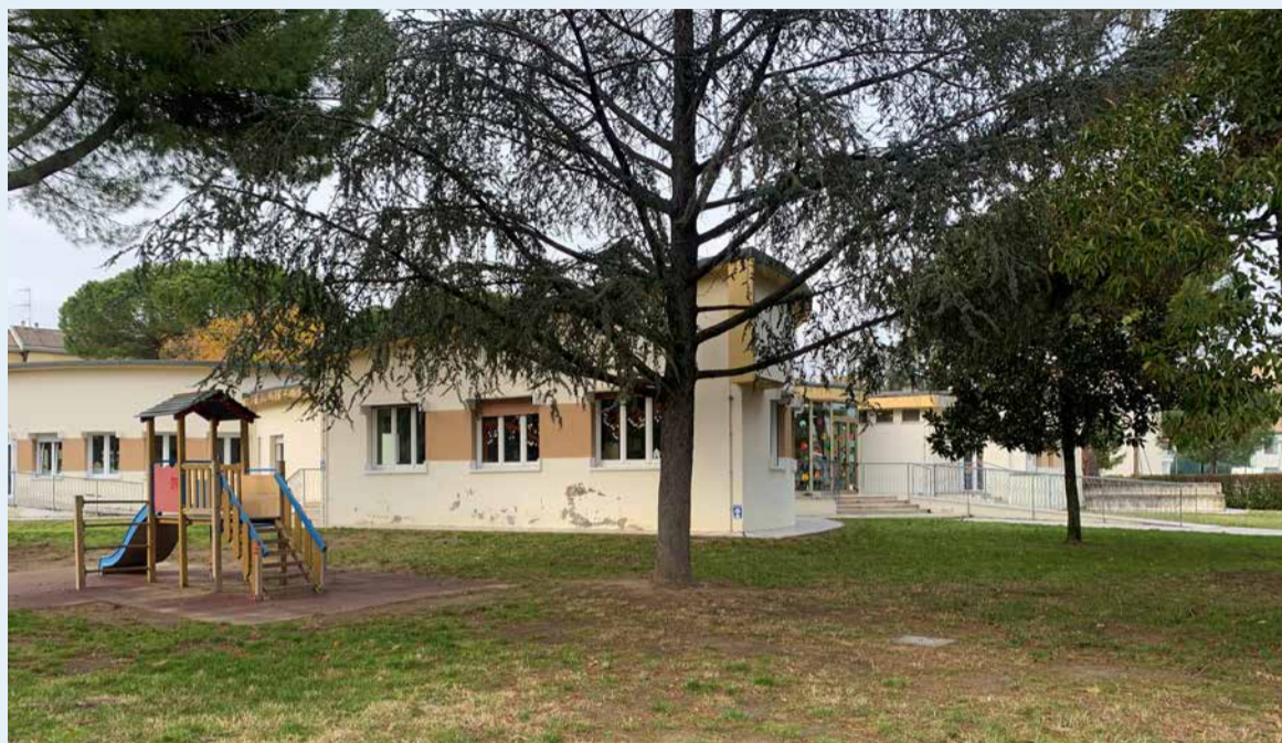
La scuola dell'infanzia "Margherita" in via Togliatti, dove sono previsti lavori di ristrutturazione edilizia e adeguamento sismico

È di quasi 300mila euro, infine, la spesa per tombinare il canale consortile Brancona in via del Duro che, oltre a un considerevole miglioramento della sicurezza idrica, consentirà ai residenti del ghetto di usufruire di un maggior numero di posti auto.