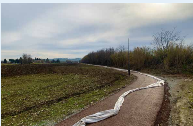
Il tratto della nuova ciclabile dal lago Santarini fino a via Pallada

ranno invece a vedersi i primi movimenti sul cantiere della passerella sul ponte: l'impresa esecutrice sta infatti procedendo alla realizzazione delle travi e degli altri componenti in acciaio che costituiranno la struttura della passerella. Agganciata a sbalzo sul lato nord, la passerella ciclopedonale sarà larga circa 3 metri, percorribile in entrambi i sensi di marcia e protetta sia nel fianco esterno che in quello interno. I lavori, che termineranno entro la primavera 2024, non intralceranno il traffico sul ponte: per il montaggio delle strutture, infatti, l'impresa impiegherà grandi macchinari e gru posizionati sul letto e sulle sponde del fiume Marecchia, lavorando quindi dall'esterno e dal basso.