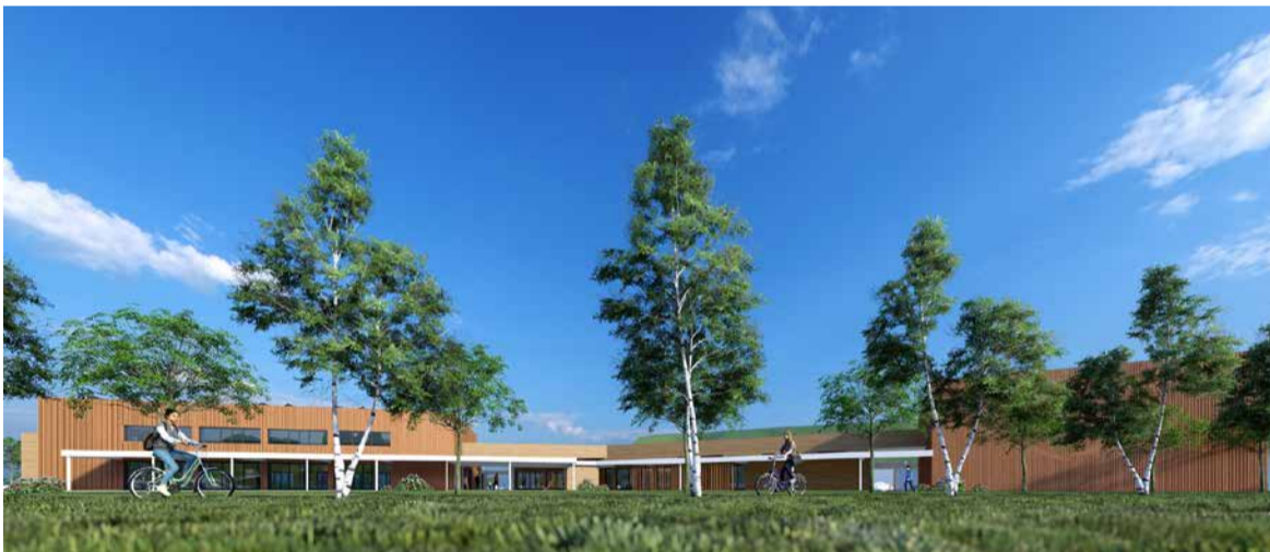
Un dettaglio del progetto del Parco dello Sport

mentari di Coni e Federciclismo, il parco ospiterà al suo interno altre attività sportive agonistiche e dilettantistiche come l'area skate/Bmx e i cinque campi da paddle al coperto.